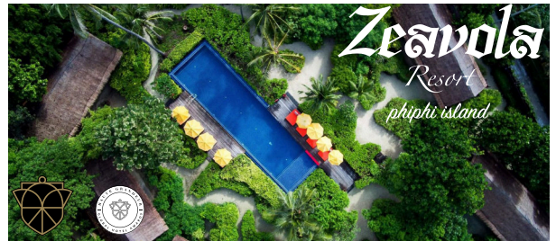
HAUTE GRANDEUR | GLOBAL HOTEL AWARDS | ZEAVOLA RESORT FOR BEST ECO FRIENDLY RESORT